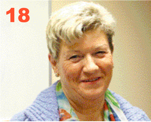
LCHF-revolutionen i Säffle