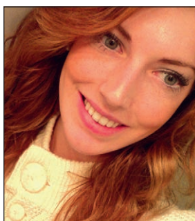
Omslagslayout: Birgitta Hallin Andersen

2. Du har väl sett att vi finns på Facebook? Gå gärna in och gilla oss på www.facebook.com/lchfmagasinet